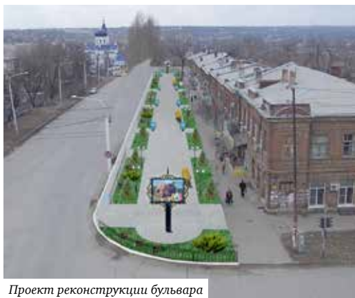
Проект реконструкции бульвара